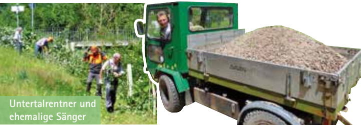
Untertalrentner und ehemalige Sänger